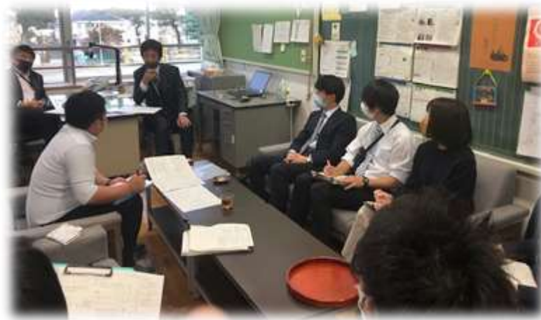
そして、これが一小の自慢!! 白熱の協議会