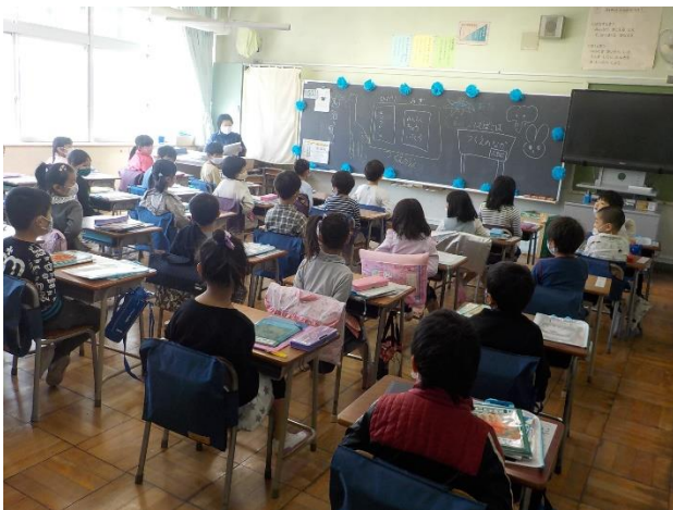
【朝の健康観察・1組】

※絵の具セットを購入希望の方は、本日配布しました申し込み袋に必要金額を入れてお持ちください。保護者会終了後、担任にお渡しください。