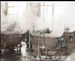
くにたち郷土文化館蔵