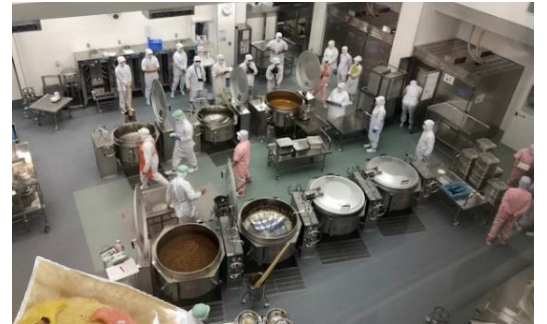
ドライフロアで清潔な調理場