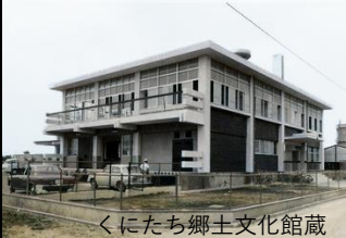
くにたち郷土文化館蔵