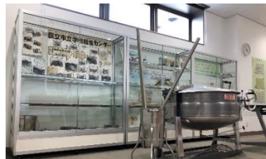
展示も栄養士さんたちの楽しい工夫がいっぱい!