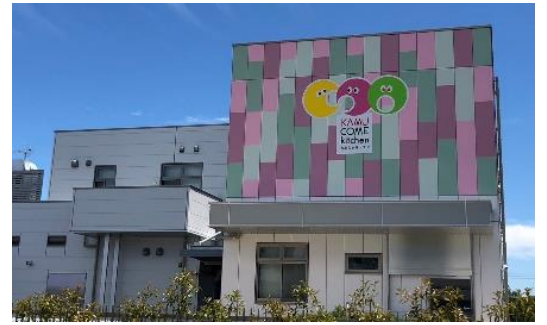
外観には可愛いイラストがあります