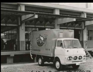
くにたち郷土文化館蔵