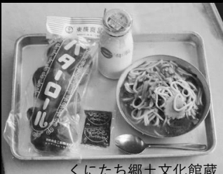
くにたち郷土文化館蔵