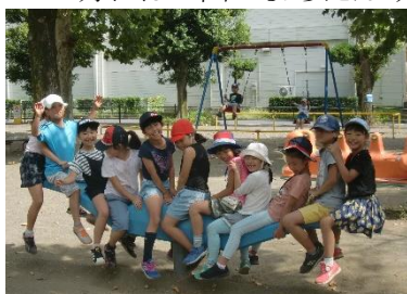
まちたんけん（上公園にて）

10月には2回のまちたんけんを通して、自分たちの住む街について知り、愛着を深めることができました。3回目のたんけんは、11月7日（木）3・4校時を予定しています。ご都合よろしければ、引率のお手伝いをお願いできると大変ありがたいと思います。