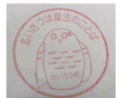
あいさつキャラクター

12月15日（月）～19日（金）にかけて、あいさつ運動とユニセフ募金を同時に実施します。代表委員会を中心となり活動していきます。あいさつ運動では、イメージキャラクター「あいろん君」が全校デビューします。1学期のあいさつ運動からレベルアップし、あいさつがしっかりできたか学級で振り返りをしていきます。ユニセフ募金では、映像やポスターを用いて活動のめあてを伝えていきます。「助け合いの気持ち」を持たせられるように募金活動を行います。