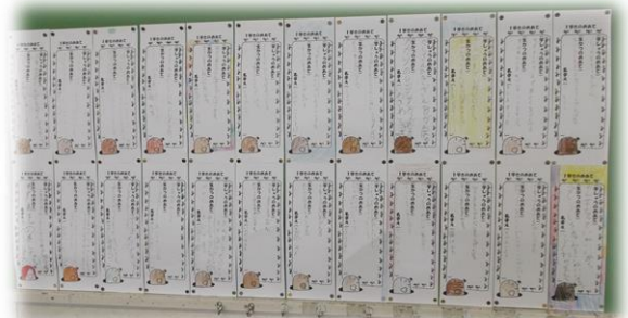
写真① 一人一人が作成した1学期のめあて

5月も引き続き、本校の教育活動にご理解、ご協力いただきますようよろしくお願いいたします。