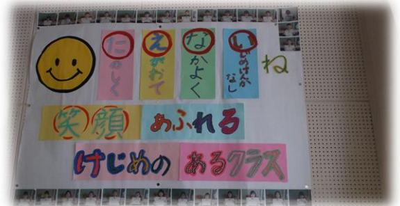
写真② みんなで決めた学級目標