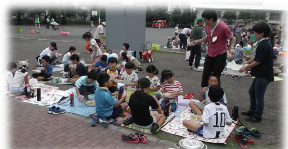
みんなで仲良くカレーを食べました。