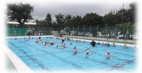
夏季水泳指導(第1回) ~7月23日(火)~

今日から2学期が始まりました。1学期の終業式では、夏休みに向けて「命を大切にし、全員が元気に2学期の始業式を迎えること」「思い出をたくさん作ること」の2つを子供たちに伝えました。本日、子供たちが大きな事故やけがもなく、輝くような表情で登校できたことをうれしく思います。保護者、地域の皆様におかれましては、夏休み中の子供たちへの指導、そして温かい見守りをさせていただき誠にありがとうございました。