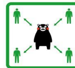
くっつかないモン #KeepDistance