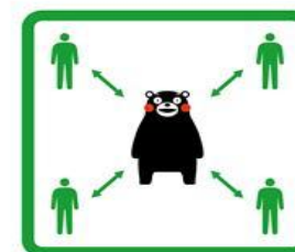
くっつかないモン #KeepDistance