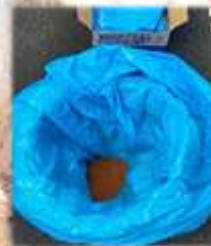
スケットイレ オガクズでゼリー状に 固まる非常用トイレ