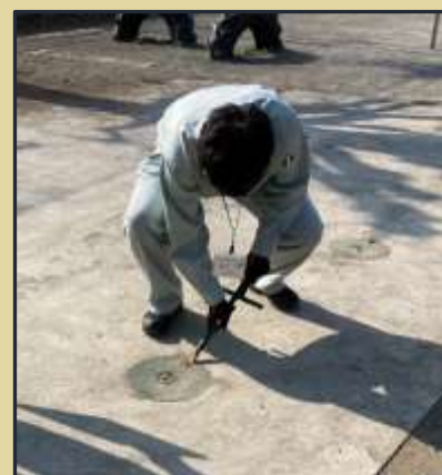
マンホールトイレ

下水管に直結した小さなマンホール上に便座を置きテントで覆って使う仮設トイレ。全10基のうち1つは車椅子用。水が使えない場合は凝固剤で固めるタイプの「スケットイレ」使用。