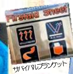
サバイバルブランケット