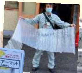
エアーマット ストローで膨らませて使う