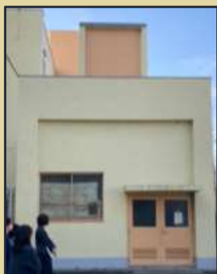
備蓄倉庫 市内小中 11校中最大