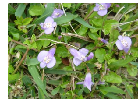
ムラサキサギゴケ