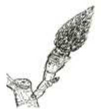
セータータイプ (モクレン)