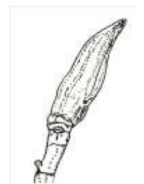
革ジャンタイプ (ホオノキ)