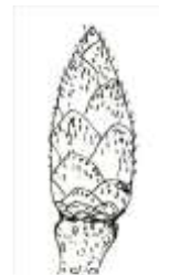
重ね着タイプ (サウシバ)