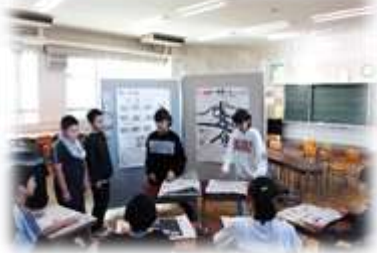
(写真は昨年度のもの)

年明け1月(1・3・5年生)と2月(2・4・6年生)に、七小タイムで学んできたことを全校児童に発表する「わくわく発表会」を開催します。より多くの子供たち、地域や保護者の方に参観していただきたく、今年度より2回に分けての実施となりました。様々な学年の発表に耳を傾け、頑張りや次への励ましの一言を掛けていただくと幸いです。子供たちの発表に、どうぞご期待ください!